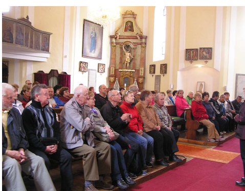
V kostele Panny Marie Pomocné z Hvězdy