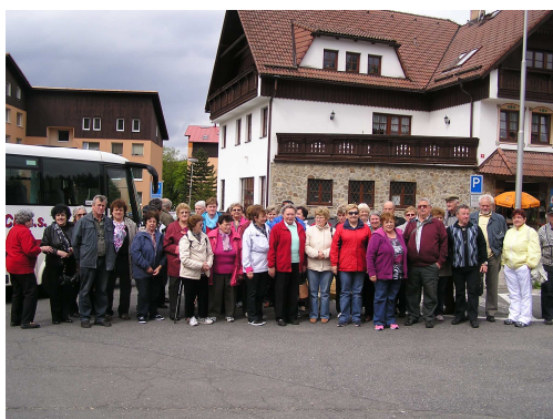
Na Železné Rudě