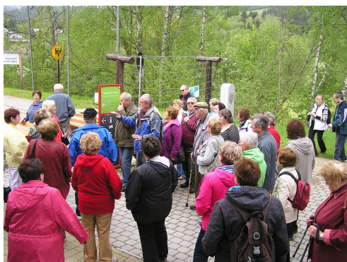
Státní hranice v Alzbětíně