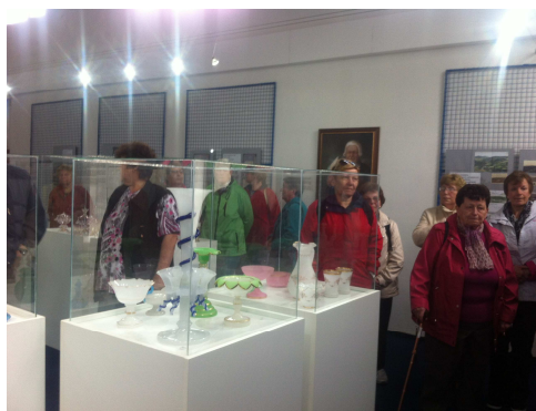
Ve sklárně v Anníně

Předposlední květnový čtvrtek obec Vacov již podruhé uspořádala výlet seniorů po Šumavě. Tentokrát jsme navštívili Sklárnou v Anníně, kde se snaží zachránit sklářskou tradici v této oblasti. Další naše cesta vedla na Železnou Rudu. V kostele Panny Marie Pomocné z Hvězdy nám paní průvodkyně podala velmi zasvěcený výklad o jeho vzniku a historii, který musel být, pro velkou zimu uvnitř kostela, trochu zkrácen. Na nádraží v Alzbětíně jsme překročili státní hranici a nakoukli do Bavorska. Po velmi vydatném obědě v Čechách jsme se vrátili opět do Německa a vyjeli pod Velký Javor. Déšť nám ale změnil naše plány, plánovanou procházku nám nedopřál. Závěrem jsme navštívili rodinný pivovar v hotelu Belveder, ochutnali některá jejich piva, poslechli přednášku o výrobě a nakoupili si i nějaké domů.