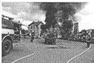
...ukázka techniky a hašení.