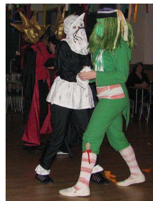
... z maškarního bálu...