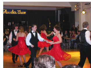
Z Plesu obce Vacov 2009