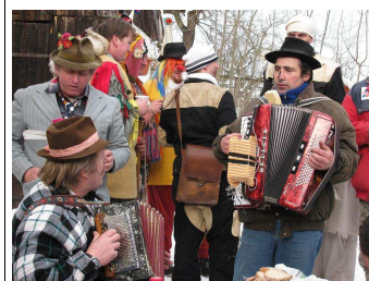
v Přečíně ...