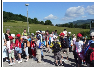
Foto z výletu ZŠ

Už jste někdy stihli za dopoledne vidět v Anglii Orient expres, na arabské poušti velbloudy, v indické džungli slony? V jediný den potkat beduíny, jogíny, thajské piráty, japonské samuraje, indiány a medvěda? Děti z 1.-4. třídy naší školy ano. Ve středu 17.6. jsme jeli do Českého Krumlova na komediální příběh Cesta kolem světa. Některé děti byly na otáčivém hledišti poprvé, o to byl jejich zážitek větší. Počasí nám přálo, cesta uběhla bez zastávek, a tak už se teď těšíme na další výlet za kulturou.