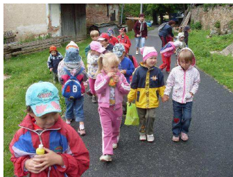
Foto z výletu