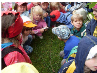
a rozloučení se s mateřskou školou