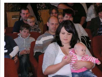
Denisu Schvarzbachero- vou